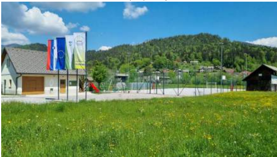
Slika 17: Športni park Dolenja vas