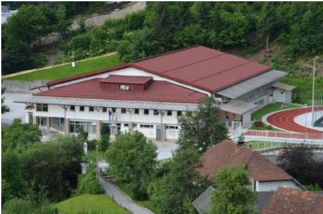
Slika 28: Športna dvorana Železniki