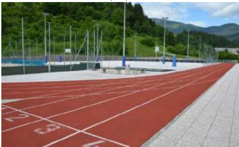
Slika 14: Športni park Dašnica