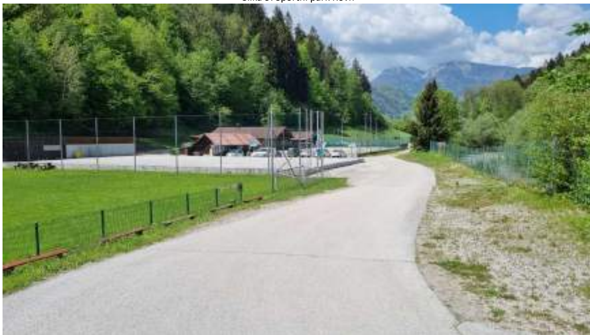
Slika 9: Športni park Rovn