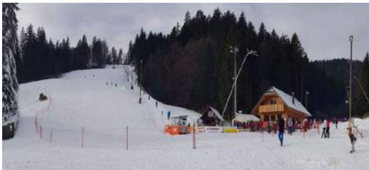
Slika 16: Smučarski center Rudno