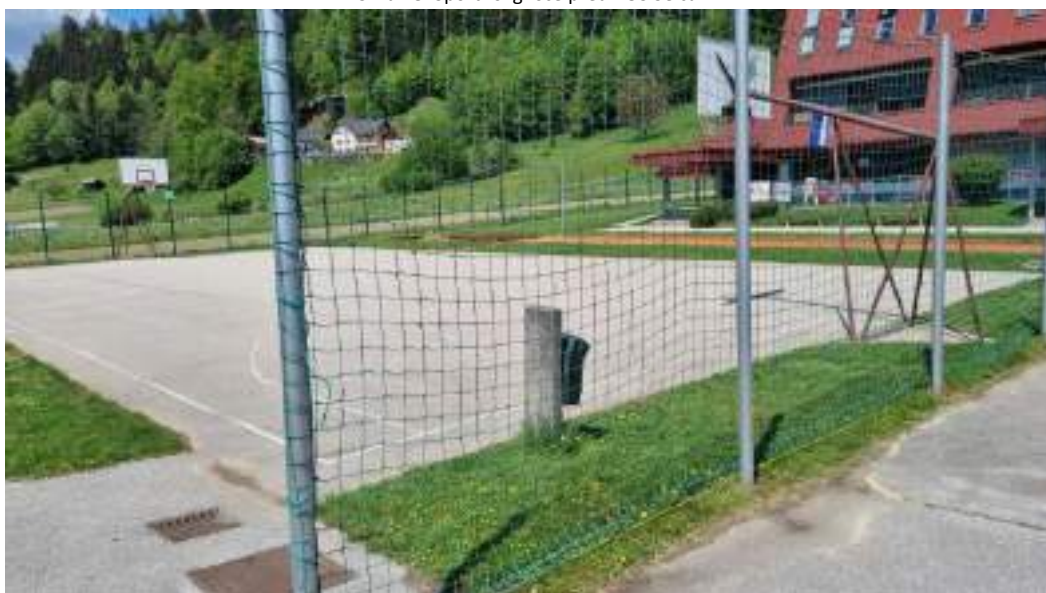
Slika 18: Športno igrišče pred POŠ Selca