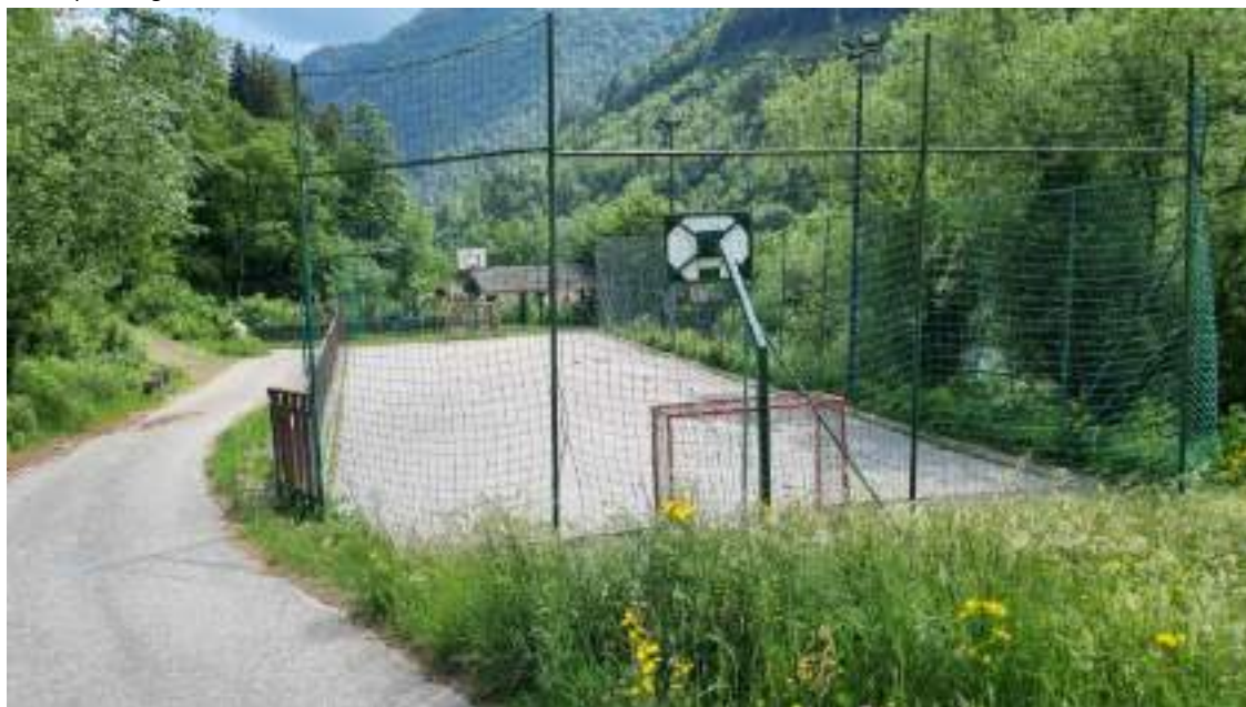
Slika 26: Športno igrišče Bele trate