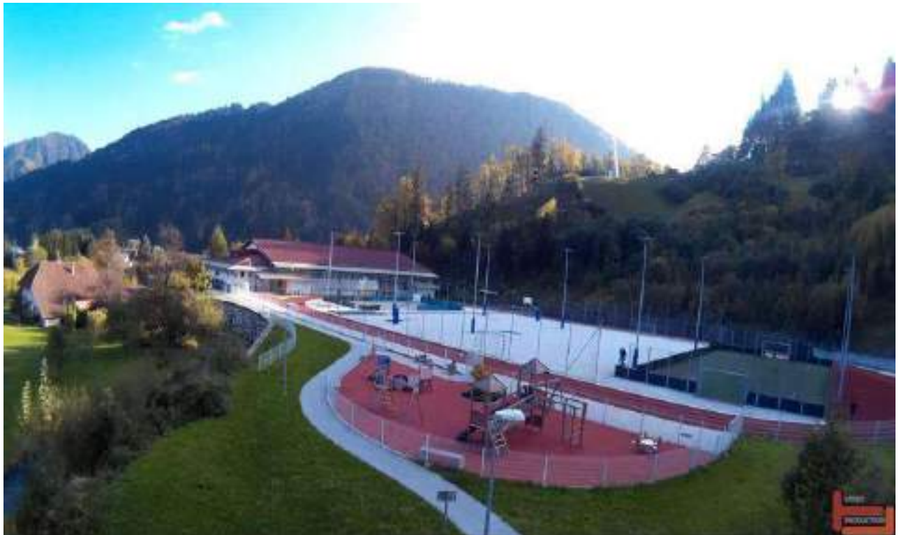
Slika 7-: Športni park Dašnica