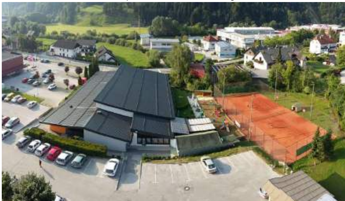
Slika 1: kompleks Plavalni bazen Železniki s teniškim igriščem