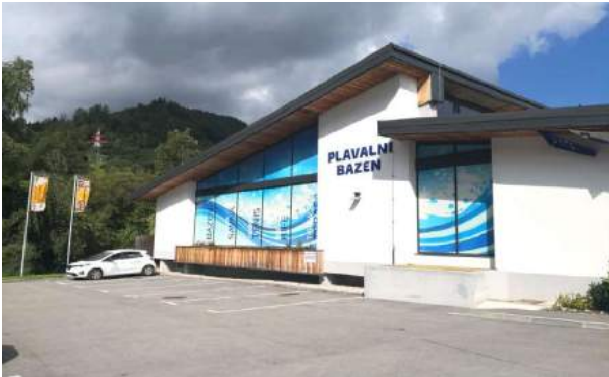
Slika 4: Plavalni bazen Železniki

- Zakon o društvih (Ur.l.RS, št. 64/11 – uradno prečiščeno besedilo in 21/18 – ZNOrg)