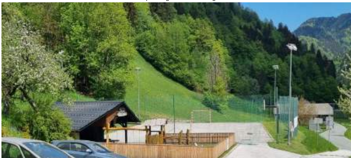
Slika 5: športno igrišče na Zalem Logu

Zaradi pomanjkanja vadbenih prostorov so nekateri prisiljeni uporabljati tudi športne objekte v drugih občinah (npr. kegljači, balinarji,...), kar povzroča še dodatne težave pri plačilu stroškov najemnin. Pogrešajo tudi klubske prostore (npr. pisarne, skladišča), ki bi jih imeli v športnih objektih. Invalidska društva opozarjajo, da nekateri objekti niso ustrezno opremljeni oz. dostopni invalidom.