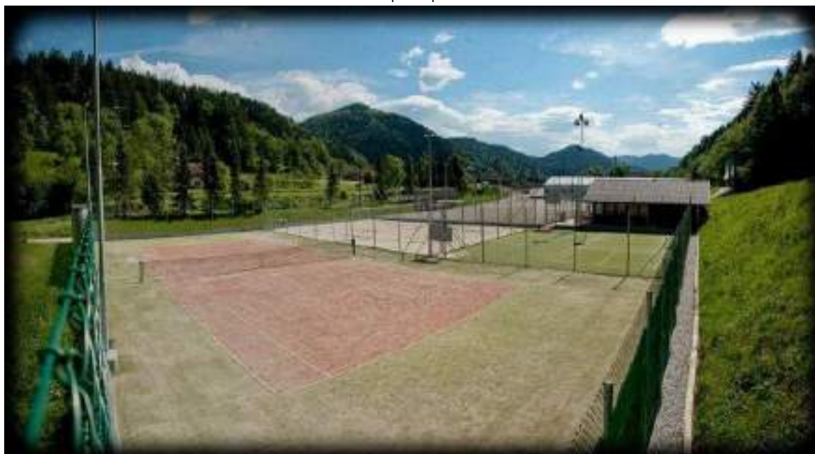
Slika 15: Športni park Rovn