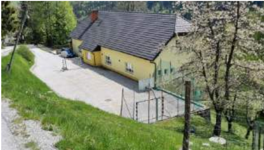
Slika 2: Igrišče pred šolo v Davči

Drugi del dokumenta je namenjen predstavitvi vizije, ciljev in ukrepov, torej tistega, česar bi bil šport lahko deležen v prihodnjih desetih letih. Za posamezno področje (vsebina, infrastruktura, kadri, promocija) so predvideni želeni