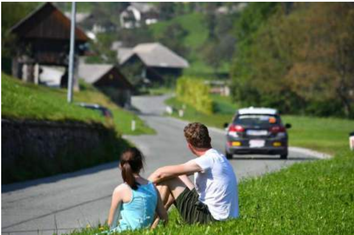
Slika 8: Športni dogodek Rally Železniki

Za strokovno delo na področju športa skrbijo vaditelji in trenerji, sodniki, medicinski delavci, menedžerji, administrativni ter tehnični delavci, itd. V povprečju to pomeni, da je v vsakem klubu vsaj pet strokovnih delavcev (seveda pa ima nekaj klubov v ekipnih športih bistveno več strokovnjakov od ostalih). Po razpoložljivih podatkih je med njimi veliko prostovoljcev, nekaj honorarnih sodelavcev in nobenega profesionalno zaposlenega.