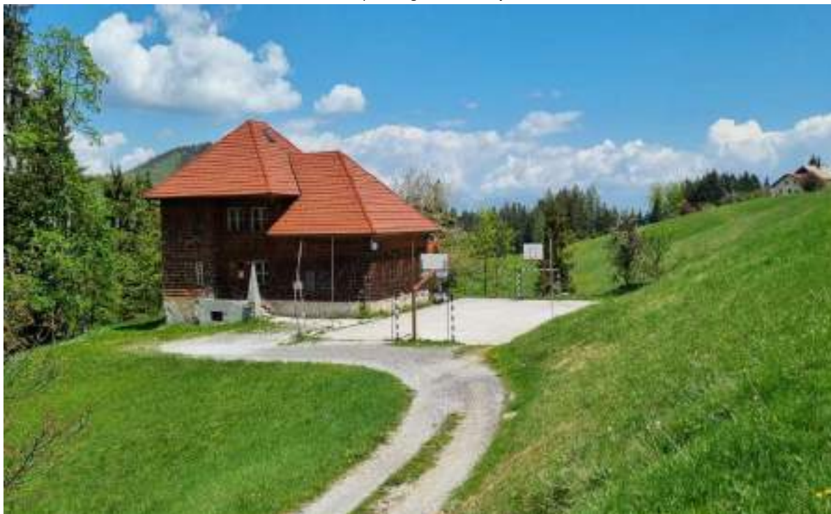
Slika 25: Športno igrišče v Martinj Vrh