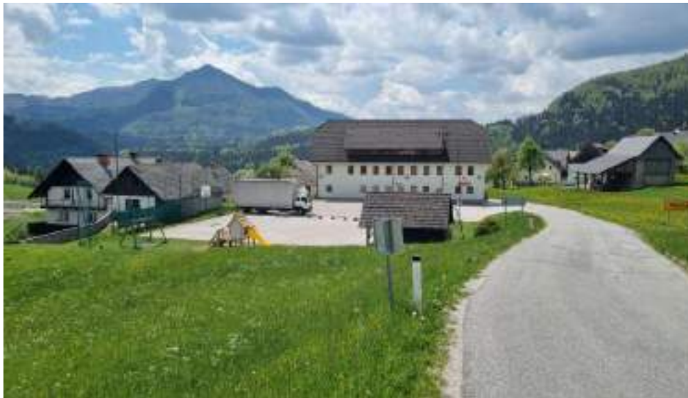
Slika 10: Igrišče v Sorici

brez šolanih in izobraženih vaditeljev, trenerjev in drugih strokovnih kadrov si težko predstavljamo delovanje športa. Zakon o športu je natančno opredelil zahteve o izobrazbi in usposobljenosti ljudi, ki delajo na področju športa. Zato bomo v občini vsako leto poskušali izšolati ali došolati več trenerjev in vaditeljev, ki bodo sposobni dvigniti raven in kvaliteto vadbe in treniranja v posameznih športnih panogah. Ker pa je posamezna oblika izobraževanja zelo draga, bo lahko Javni zavod Ratitovec pridobil dodatna sredstva in v prihodnjih letih pripravljati razne seminarje in tečaje.