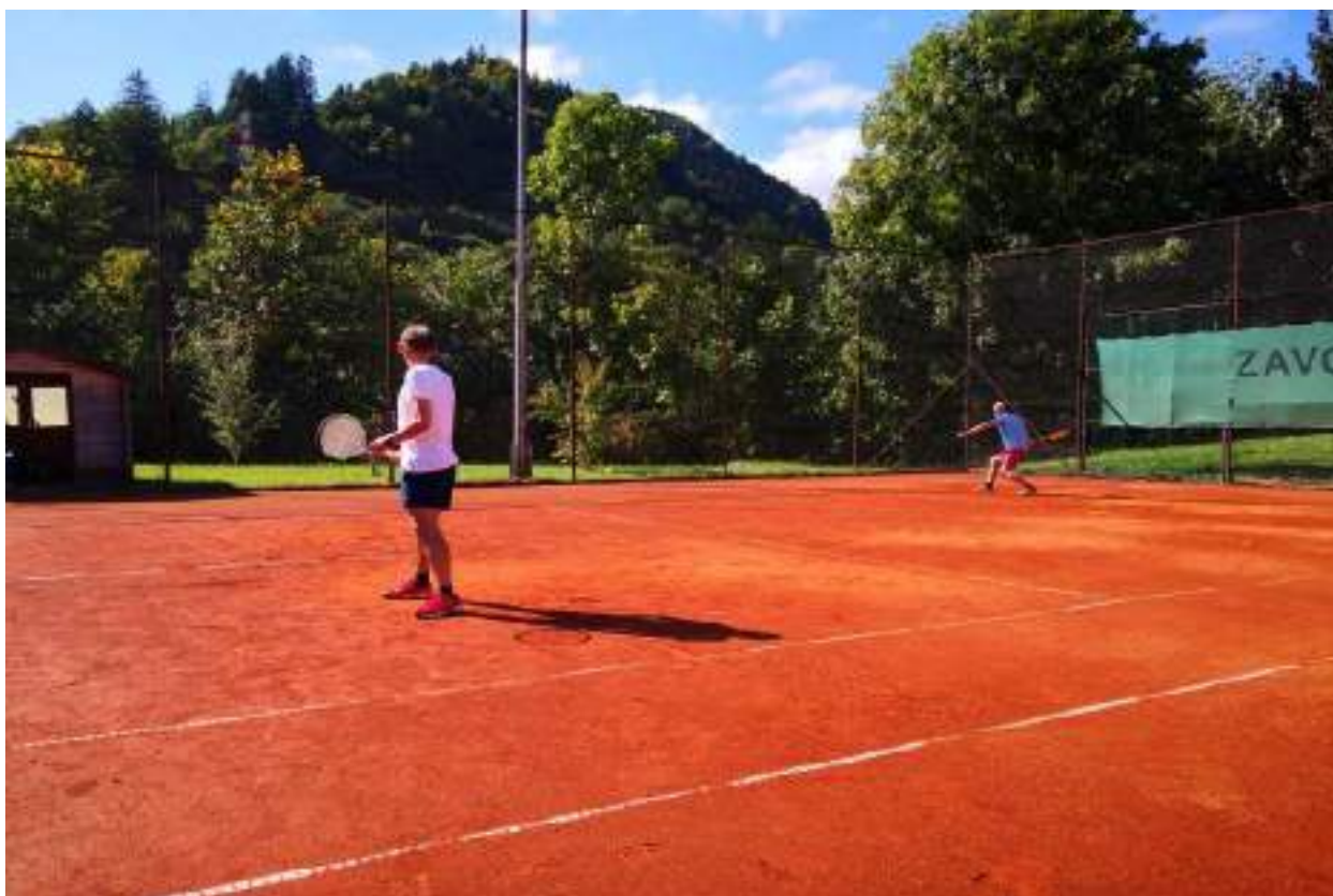
Slika 27: Tenis Bazen Železniki