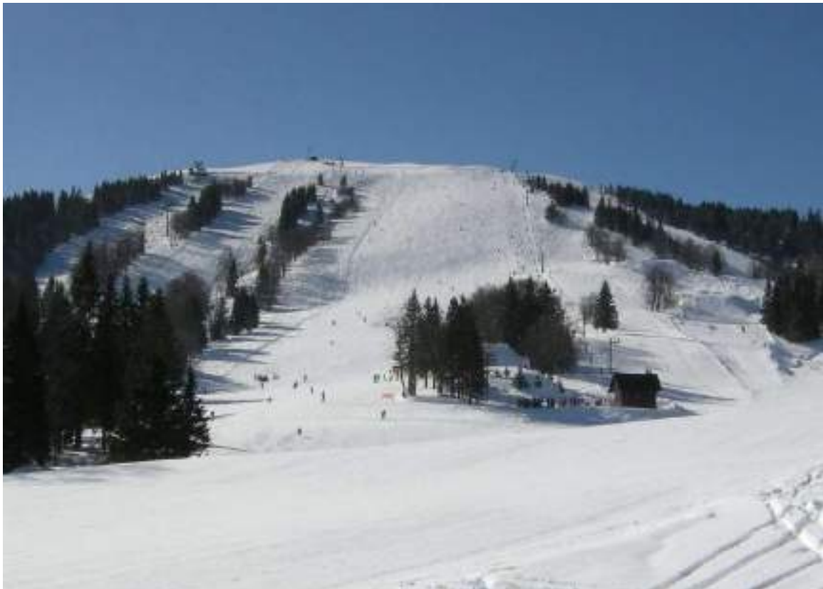
Slika 6: Smučišče na Soriški planini

Društva delujejo od 5 do 46 let (športno kinološko društvo). Planinsko društvo je vključeno pod turizem, čeprav je v poslovnem registru navedeno, da je njihova glavna dejavnost