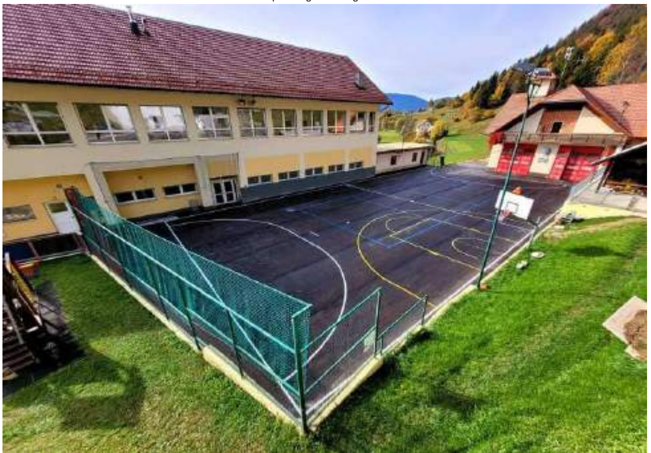
Slika 29: Športno igrišče Dražgoše