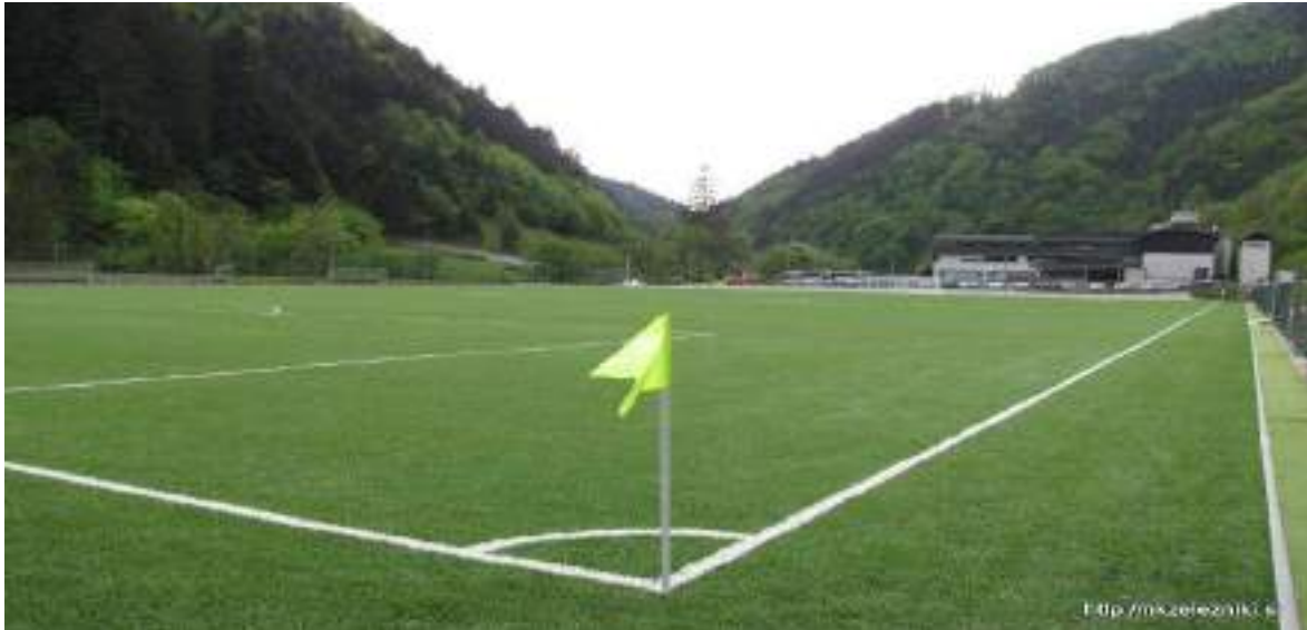
Slika 3: Nogometno igrišče Nivca (NK Železniki)

Občini Železniki je v naslednjih letih cilj zgraditi, dograditi in vzdrževati primerno športno infrastrukturo, povečati število športno aktivnega prebivalstva v občini, okrepiti športna društva ter pridobiti primerno športno izobražen in usposobljen kader.